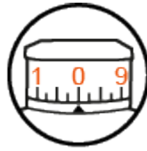
Tourelle d'élévation EasyRead