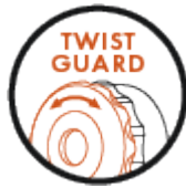
TWIST GUARD torsion protection