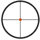
1. Plan focal