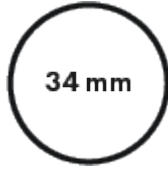
Diamètre du tube central 34mm