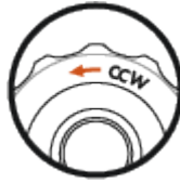
Direction de réglage CCW